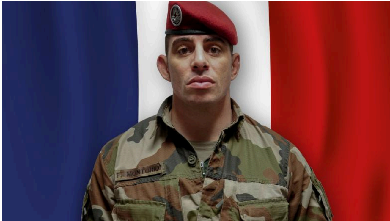
Sergent-chef Florian Montorio